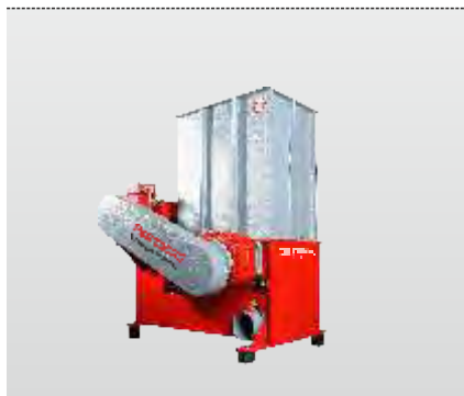
Série AZR 50 Primus :

Le modèle entrée de gamme dans la technologie des broyeurs à poussoir hydraulique