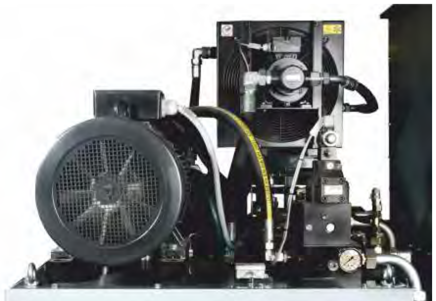
Centrale hydraulique équipée d'une pompe à piston et un système de refroidissement pour une production en plusieurs postes

La presse à briquettes RB 400 RS – une technique de compression fiable à débit élevé pour une production industrielle de briquettes rectangulaires destinées de par une réduction de volume a la valorisation thermique. La densité élevée des briquettes rectangulaires est optimale pour le stockage et le transport. De plus ces briquettes très denses ont une bonne durée de combustion. Laissez-vous conseiller de quelle manière optimale votre matière peut être valorisée en briquettes.