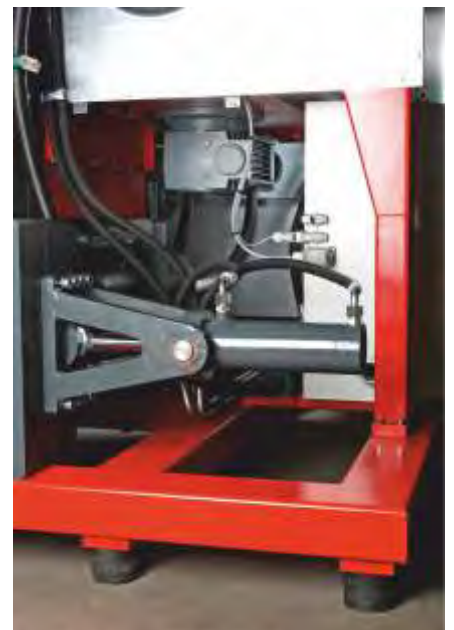
Vérin hydraulique puissant, Moteur réducteur pour l'axe mélangeur et la vis d'alimentation