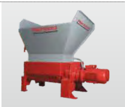
Série RMZ 500 - RMZ 1000 :

Broyeur à mono rotor pour le broyage efficace des matières plastiques