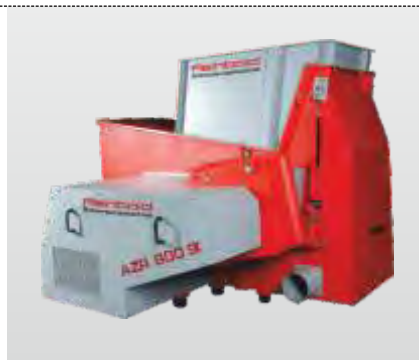
Série AZR 600 K - 2000 K Gigant :

Avec alimentation horizontale de la machine