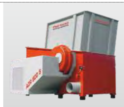
Série AZR 800 - 2000 Gigant :

Broyeur mono rotor pour le broyage professionnel de matériaux