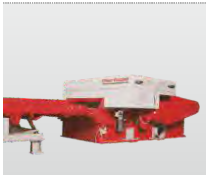
Série broyeurs RLZ 400 - RHZ 1300 S :

Broyeur mono rotor pour le broyage professionnel de matériaux