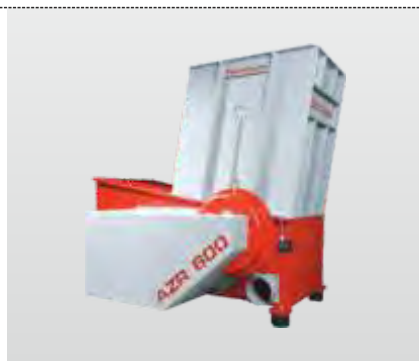
Série AZR 600 :

Le modèle entrée de gamme dans la technologie des broyeurs à poussoir hydraulique