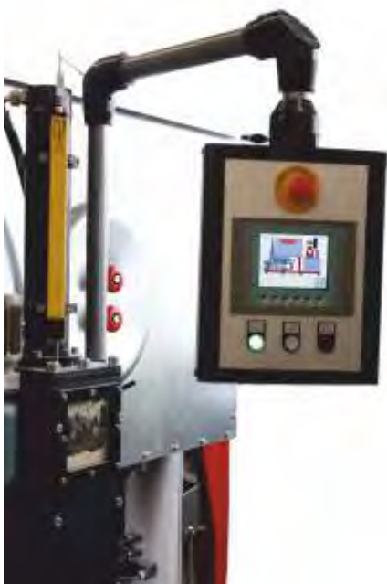
Ecran tactile de commande et de programmation de la presse à briquettes