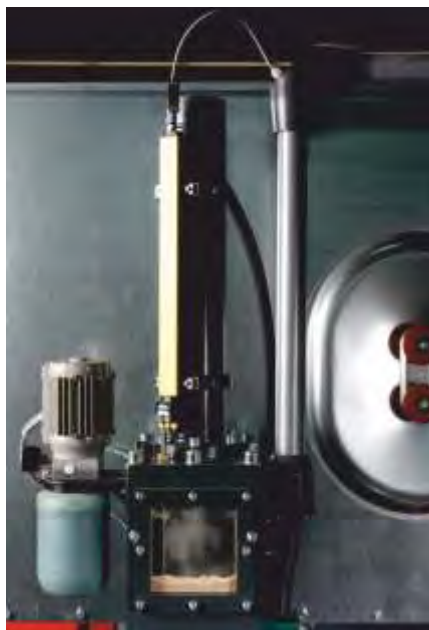
Système de contrôle et de mesure des déplacements des tiges de vérins et de la matrice de compression. A coté le module pour le graissage centralisé.